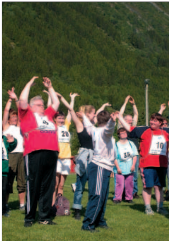
Helsesøster i Vanylven leidde oppvarmingsøkt med sikker hand.

Mangfaldet av aktivitetar er rikeleg og variert. Rullestolbrukarar og andre med omfattande funksjonshindringar har sine personlege medhjelparar med. Dei fleste av oss som er funksjonærar har vore med frå starten og er gjerne å finne på postar som vi i årevis har hatt ansvar for. Vi kjenner stort sett både medhjelparane og kvar einiskild deltakar, kan namna dei, veit korleis vi skal kommunisere og korleis vi må ta individuelle omsyn og kva dei blir glade for. Det fantastiske med Monsiaden er at den er skapt for dei utviklingshemma og blir gjennomført fullt ut på dei premisser. Valet mellom aktivitetar er svært stort. Oppgåvene er slik at alle får kjenne seg stolte ved å lykkast, også dei sterke, raske og atletiske får sine krevjande utfordringar. Boccia-turneringa er den markante