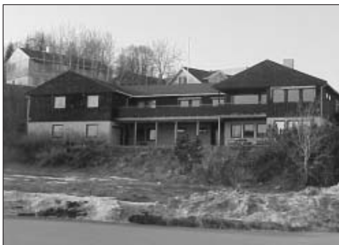
Liaveien avlastningsbolig, et synlig tegn på at foreldrene vinner frem i Midt-Troms

viduelle behov, der vi foreldre også kan få tilbud om avlastning midt i uken. Etter denne seieren for gruppa fant vi etter hvert ut at vi trengte å arbeide i litt mer ordnede former for å få saker og ting på plass. Vi ville være organisert i en sentral organisasjon slik at vi fikk mer "kraft bak stemmen vår". Vi bestemte oss for å melde oss inn i LUPE i samlet tropp og inviterte samtidig til et konstituerende møte der alle lokale LUPE-medlemmer var invitert. Møtet ble avholdt den 19. november 2003 på Finnsnes Hotell, og agendaen var å danne et lokallag av LUPE i Lenvik. På møtet var det også LUPE-medlemmer fra nabokommunene slik at det ble bestemt at lokallaget skulle favne over hele Midt-Troms.